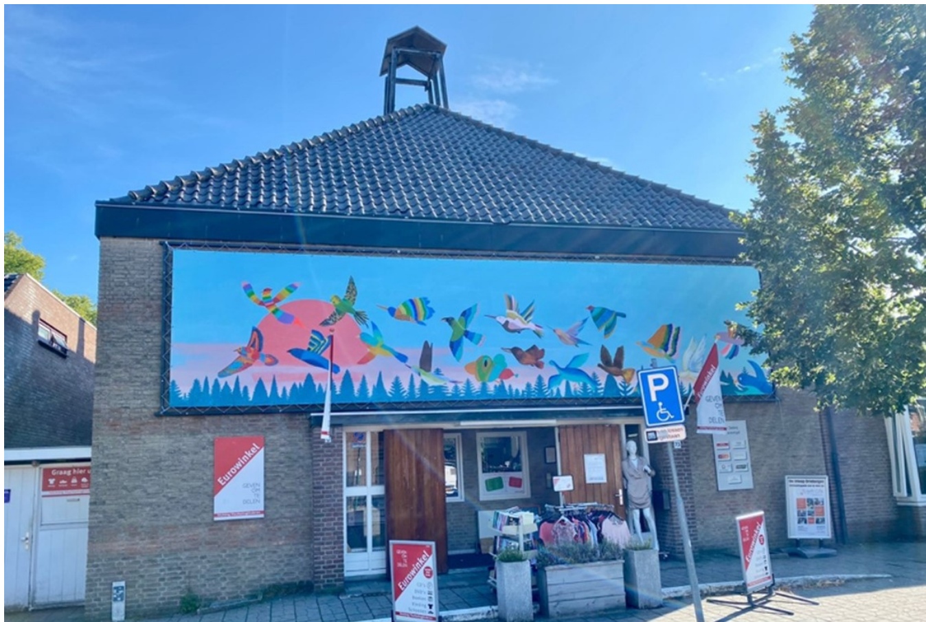
Foto: gevel Delerij met kunstwerk Driebergen-Art 2023.