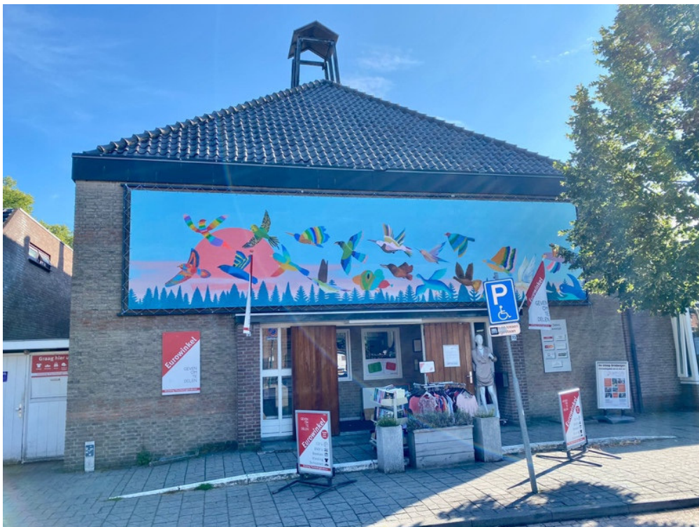
Gevel Delerij met kunstwerk Driebergen-Art 2023